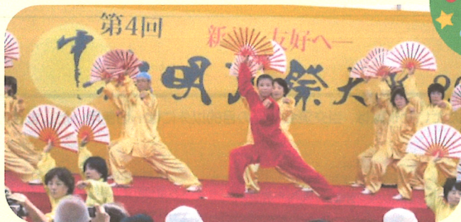
●日華里中国武術友好会による太極拳演武披露