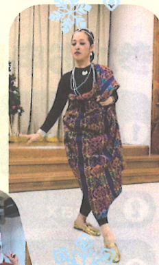
●フィリピンダンスの披露