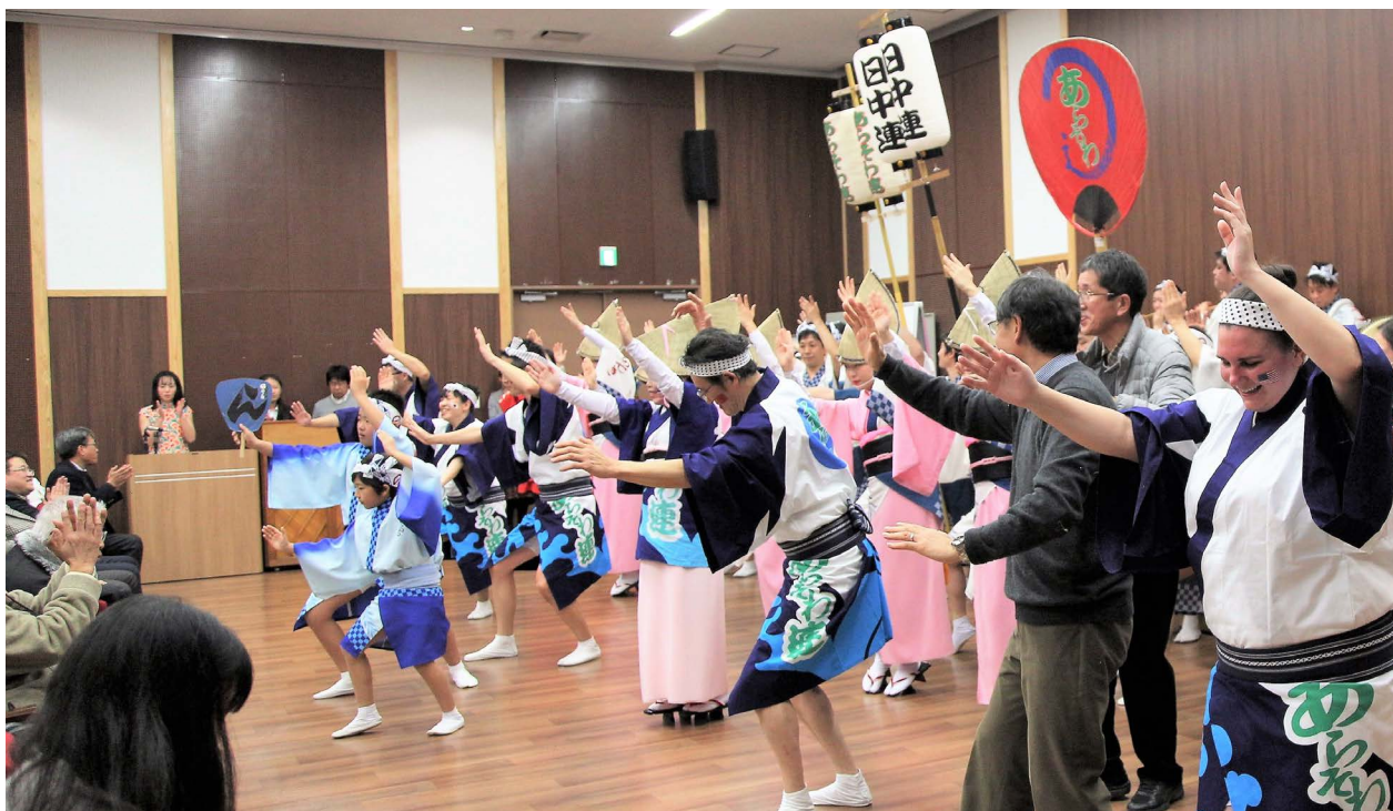
文：张楠 图：木村纯子

同为东方国家的日本，过去和中国一样庆祝农历的新年。随着时代和社会的发展，农历的各种节日也改在阳历之日庆祝，但各种传统习俗和文化却传承至今。今年2月3日是立春的前一天一节分，象征着冬去春来。古代的中国和日本都以立春作为新年的第一天，因此节分是过去农历上的除夕夜。值此迎接新春之际，德岛县内致力于国际交流的各团体共同举办了2018年迎春祝贺会，约200名德岛县民、德岛各大学的留学生及在住的外国人参加了此次活动。