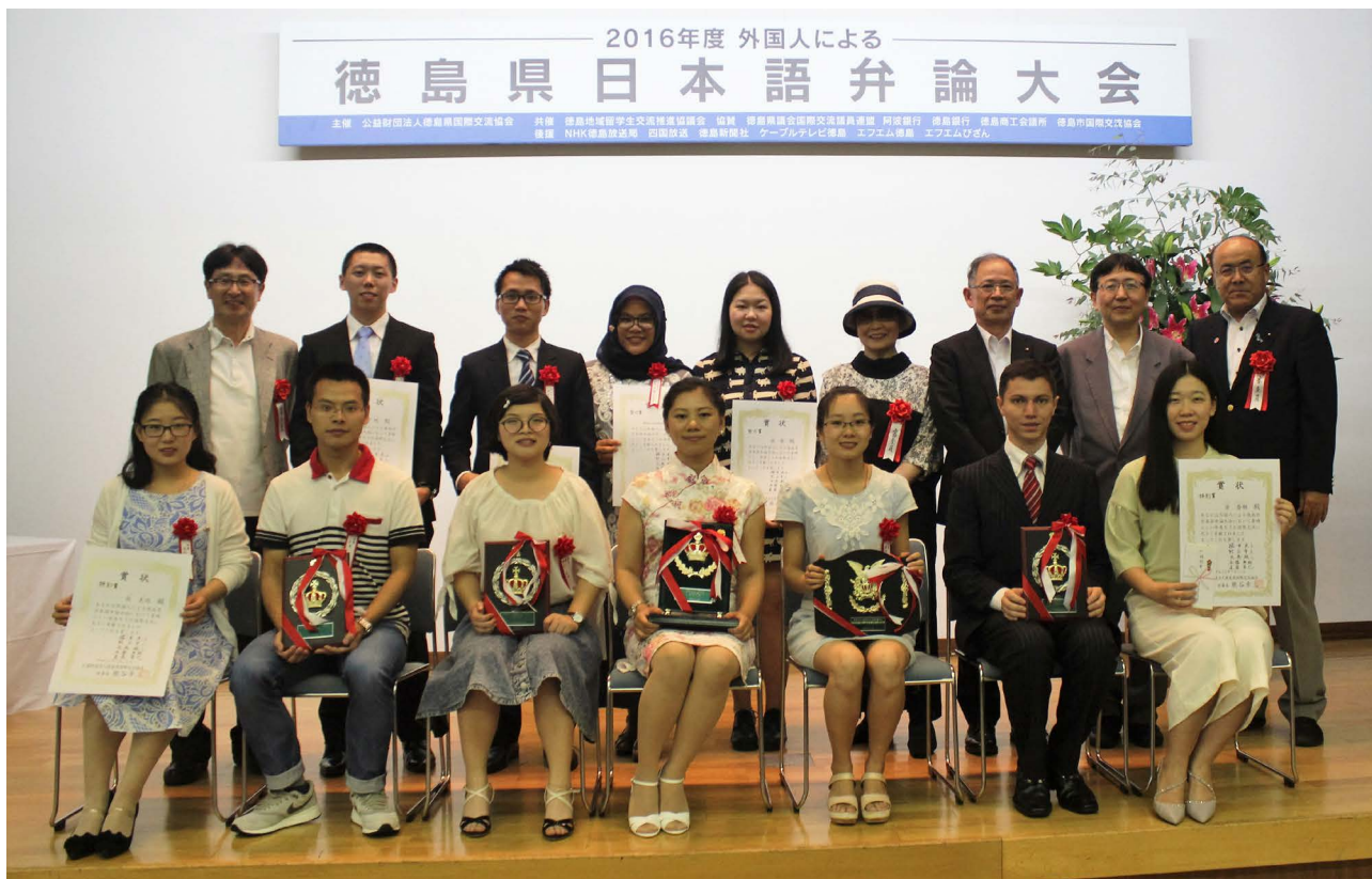
(参赛选手与评委合影)