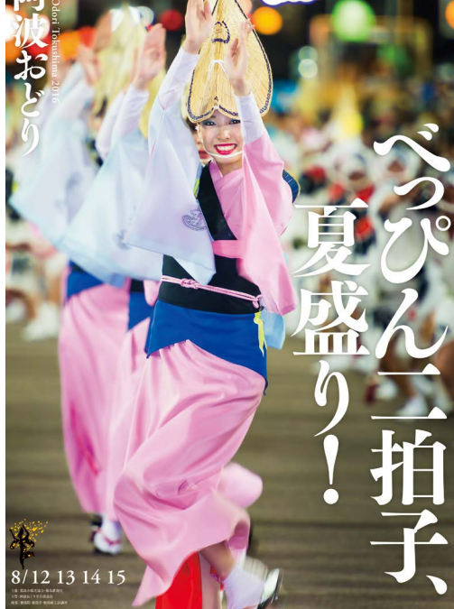
2016年阿波舞宣传海报（德岛市观光协会制作）

藤本： 光是看到照片其实大家已经知道了这是阿波舞，因此我在设计的时候有意地把“阿波舞”的字样进行了缩小，对文案的字样进行了放大。同时，为了让文案能在大家看到海报的第一时间就印入眼帘，又对其进行了一些排版和设计。主要是想突出文字带来的感受性而不是说明性。