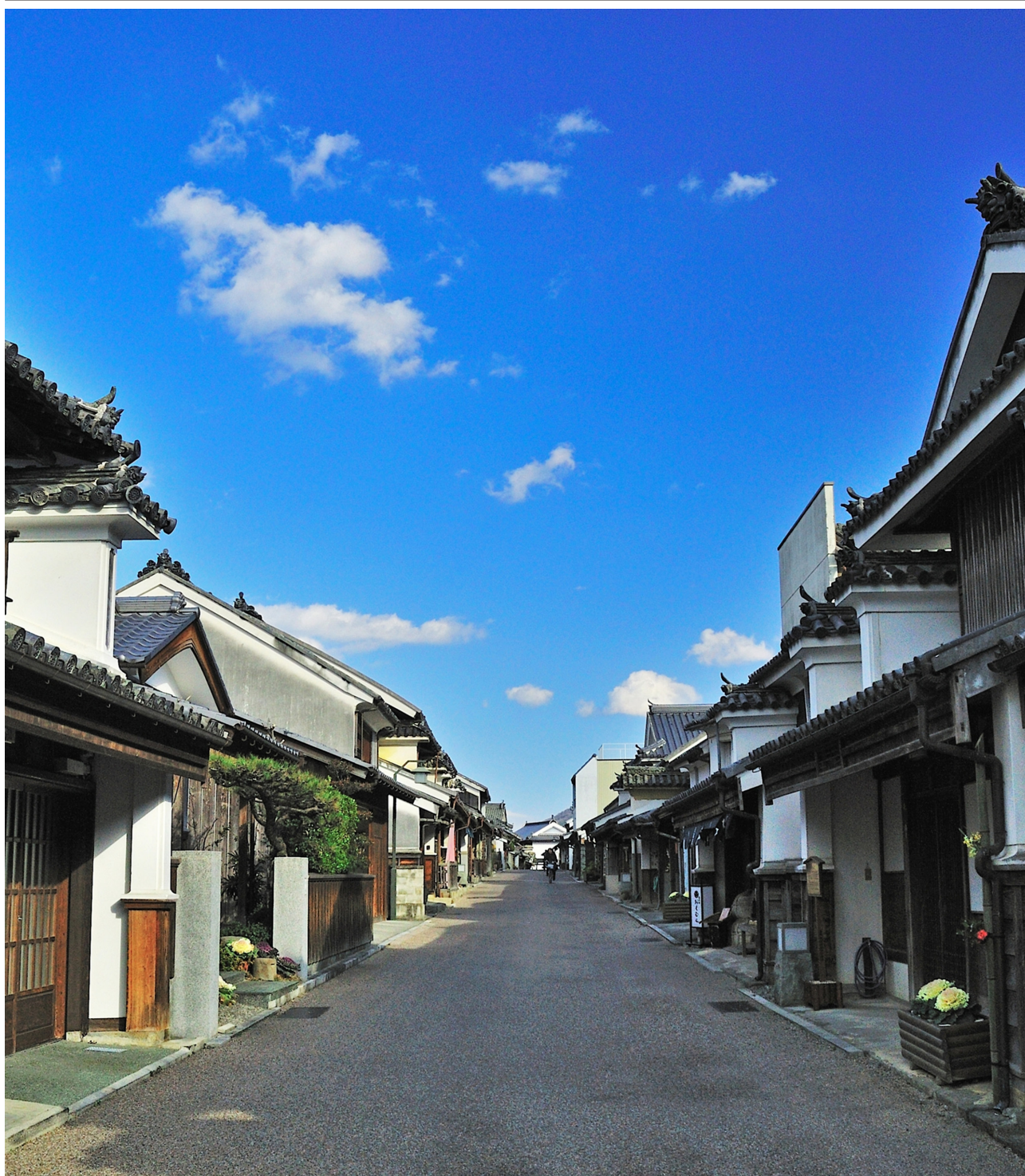
德岛县美马市脇町の卯建街道景观