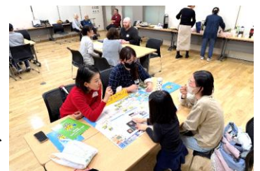
三好市での実地研修の様子

受講者の方には、今後も外国人住民に寄り添い、共に地域を支える存在として活躍していただけることを期待しています。