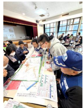
ハザードマップで 避難所を確認