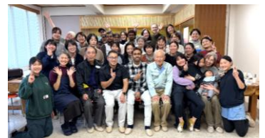
神山町での参加者