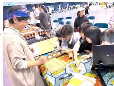
（モルディブブースにて）

令和7年11月30日（日）、アスティ徳島で開催された「お仕事体験イベント」に、JICA徳島も参加しました。当日は、JICA海外協力隊経験者（徳島県青年海外協力協会）のボランティアスタッフとともに運営し、子どもたちに「協力隊体験」をしてもらいました。まずJICAの概要を紹介した後、2つのグループに分かれて「モルディブ体験」と「ニカラグア体験」を実施しました。モルディブ体験では、モルディブの文化や言葉を学んだ後、「モルディブの幼稚園児に楽しく言葉を教えるには？」というテーマでワークショップを行いました。子どもたちからは「カルタにしたらどう？」「リズムに合わせてみたらどうかな？」といった意見が出され、みんなで実際に試しました。ニカラグア体験では、ニカラグアの文化やスペイン語の簡単なテストを行った後、「サッカーをしたいけどボールがない。どうする？」というテーマでワークショップを実施しました。あるもので工夫し、作り出す体験してもらい、協力隊の醍醐味である「考えて、作り出す」を体感してもらえたと思います。スタッフ一同とても楽しい時間を過ごしました。またお会いできるのを楽しみにしています！