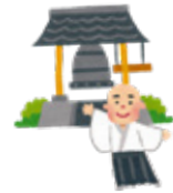
じょや かね 除夜の鐘