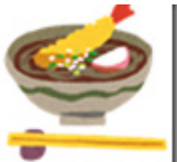
としこ 年越しそば

12月31日の「大晦日」には、年越しそばを食べます。そして、深夜0時をはさんでお寺の鐘が百八つ鳴り始めます。これを除夜の鐘と言います。