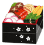
りょうり おせち料理

12月になると、年賀状を書いたり、大掃除をし始めます。年末の最後の仕事の日を仕事納めと言います。その後、たくさんの人が、遠くにいる家族に会うために、故郷に帰省します。そして、お正月を迎えるために、おせち料理を作ったり、しめ飾りや門松を準備する人もいます。