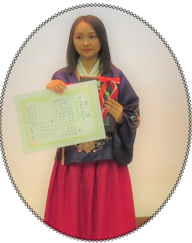
阿波银行优秀奖得主

随着世界越来越国际化，不同文化的交流更加普遍，大家通过不同文化的交流，也加深了对自己文化的理解，发现更多美好的事物和有趣的地方。