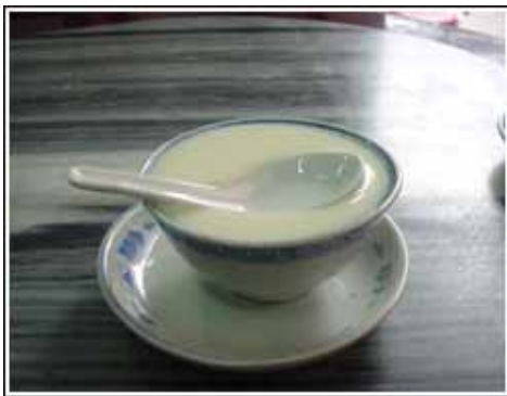
广东著名小吃 - 番俞沙湾姜汁拌奶