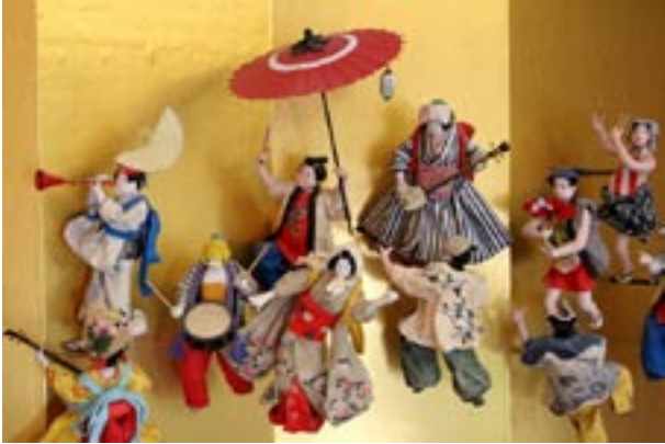
博物馆内收藏有描绘古时阿波舞模样的屏风

则都是里面夯土，外面用烧制的青砖做外墙，便利而且更加经济省事，砖缝之间用灰浆抹平，严丝合缝。而日本城墙的缝隙则奇大无比，倘若有敌人攻城的话，我想敌军不需用云梯，光是徒手便可以迅速攀上这些相对矮小的城墙。想来是因为日本古代没有象中国那样历经那么多残酷的战乱，对于攻守之术并不特别用功，怕是不只稍逊了一点。