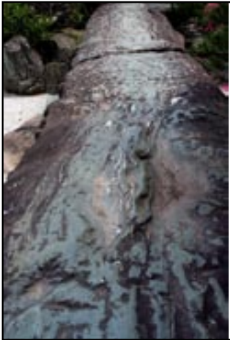
庭园里的青石板有条断缝

石铺地代替流水，配合假山，这在中国园林中似乎未见。日本庭园一向是有口碑的，虽然我以为还是不及苏州园林之精巧。地面铺就的青石，据说是德岛的特产，全日本只有这里有的，而这在中国应该是常见的了。（待续）