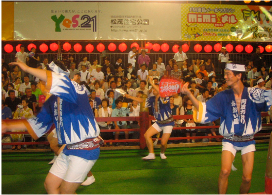
英姿飒爽的男性舞蹈

终于快到8点半，来到“南内町演舞场”，坐到工人们搭设好的“栈敷”上，长条形的场地，实际上就是道路两旁放上座位，人们坐在观众席，舞者从道路中间舞过去。在演舞场有广播，随着各个“连”的进入，即时介绍“连”的情况。