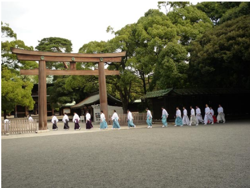
明治神宫中看到祀官们正走过大鸟居